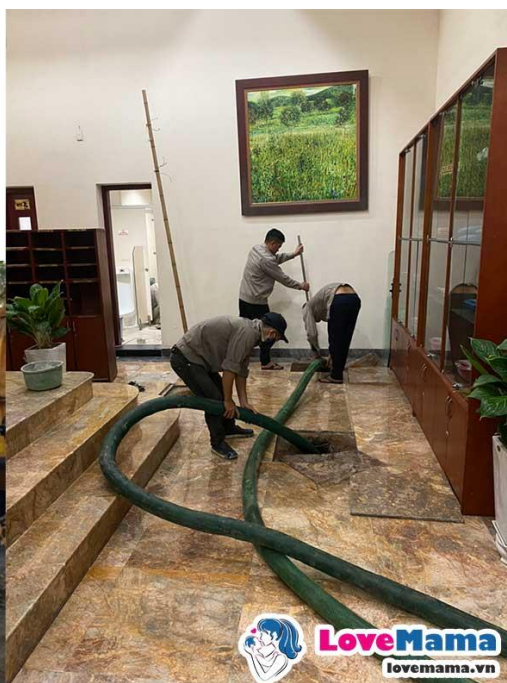
Hút Hầm Cầu - Công Ty Môi Trường Đô Thị Số 1 Hà Nội

Là công ty khá uy tín tại Hà Nội với đội ngũ nhân viên giàu kinh nghiệm xử lý các tình huống của các gia đình, công trình khác nhau, với dịch vụ: hút bể phốt, hút hầm cầu, thông công nghẹt, thông tắc bể phốt, thông cống rãnh và các dịch vụ công trình khác.