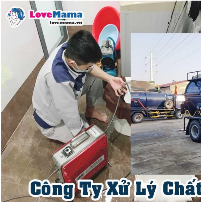
Công Ty Xử Lý Chất Thải Đà Nẵng - Hút Hàm Cầu