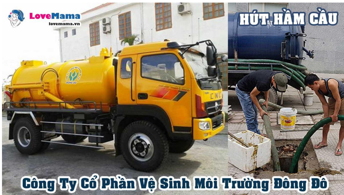
Công ty cổ phần vệ sinh môi trường Đông Đô

Công ty môi trường Đô Thị Đông Đô được thành lập vào năm 1996, là đơn vị chuyên hút bể phốt, thông tắc bồn cầu, thông tắc vệ sinh, thông tắc cống, thông tắc chậu rửa,... với chính sách nhanh từ Bắc vào Nam rất nhiều nơi.