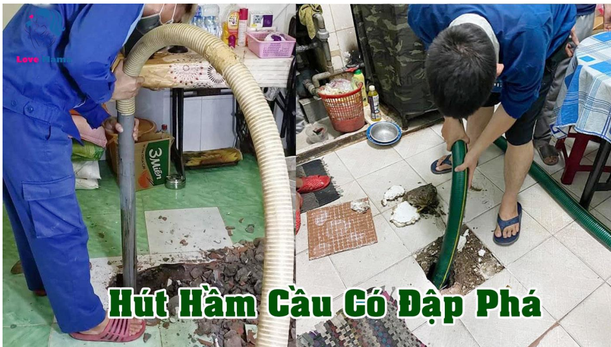
Hút hầm cầu có đục phá