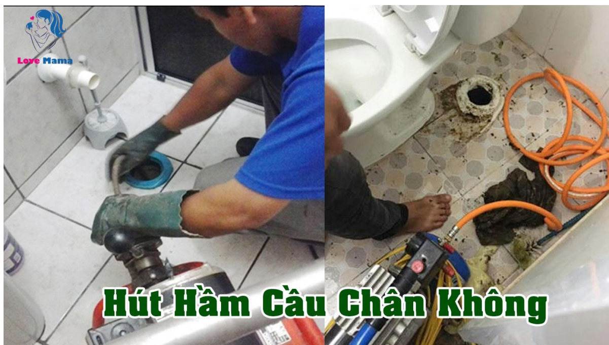
Hút hầm cầu chân không, không đục phá