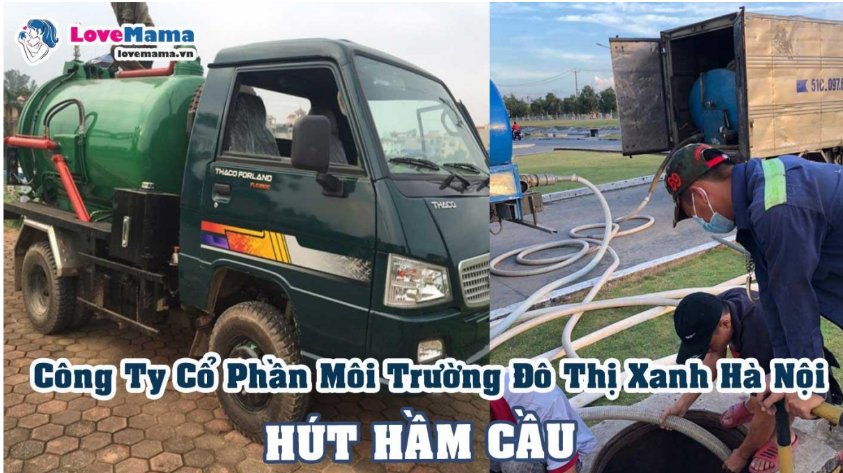
Công Ty Cổ phần Môi Trường Đô Thị Xanh Hà Nội

Đây là công ty được người quen ở Miền Bắc giới thiệu nói là: công ty chuyên hút hầm cầu, thông cống nghẹt, xử lý các vấn đề về vệ sinh môi trường khá uy tín.