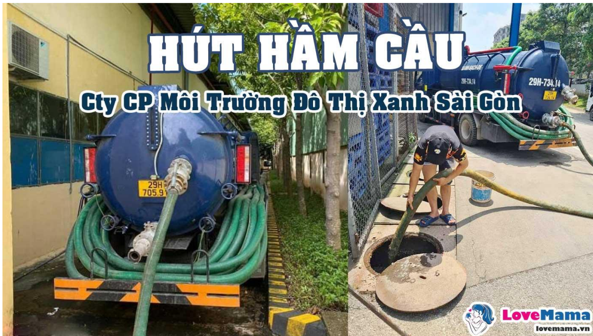
Công ty CP môi trường đô thị Xanh Sài Gòn

Công ty cổ phần môi trường đô thị Xanh Sài Gòn, là đơn vị có hơn 10 năm kinh nghiệm trong lĩnh vực dịch vụ về hút hầm cầu, nạo vét hố ga, hút bể phốt, thông cống nghẹt và nhiều lĩnh vực khác về môi trường.